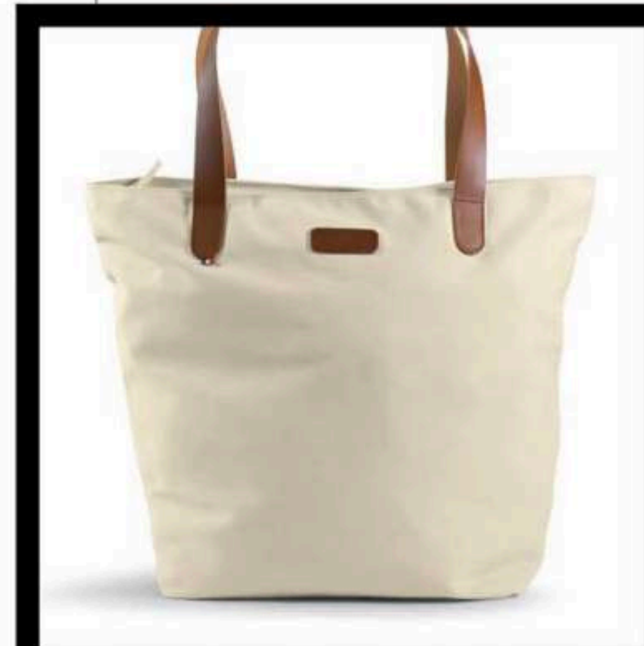
GAVOTTE CGB2262 - SAC CABAS - PAGE 105