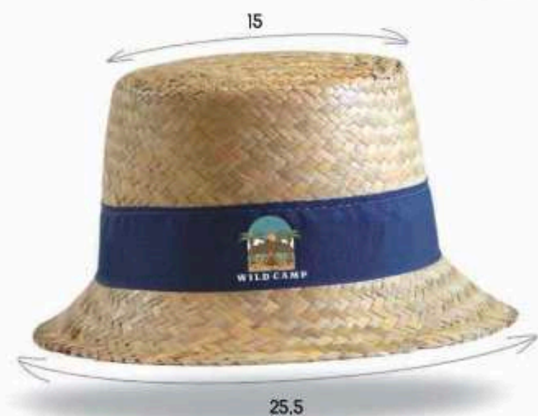
BOB01 Chapeau en paille dorée Bandeau cousu Taille : 57 ou 59 au choix Quantité mini : 100 pièces