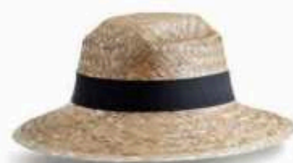
HAV01 - HAVANA Chapeau en paille dorée avec biais paille Bandeau cousu Taille : 57 ou 59 au choix Quantité mini : 100 pièces