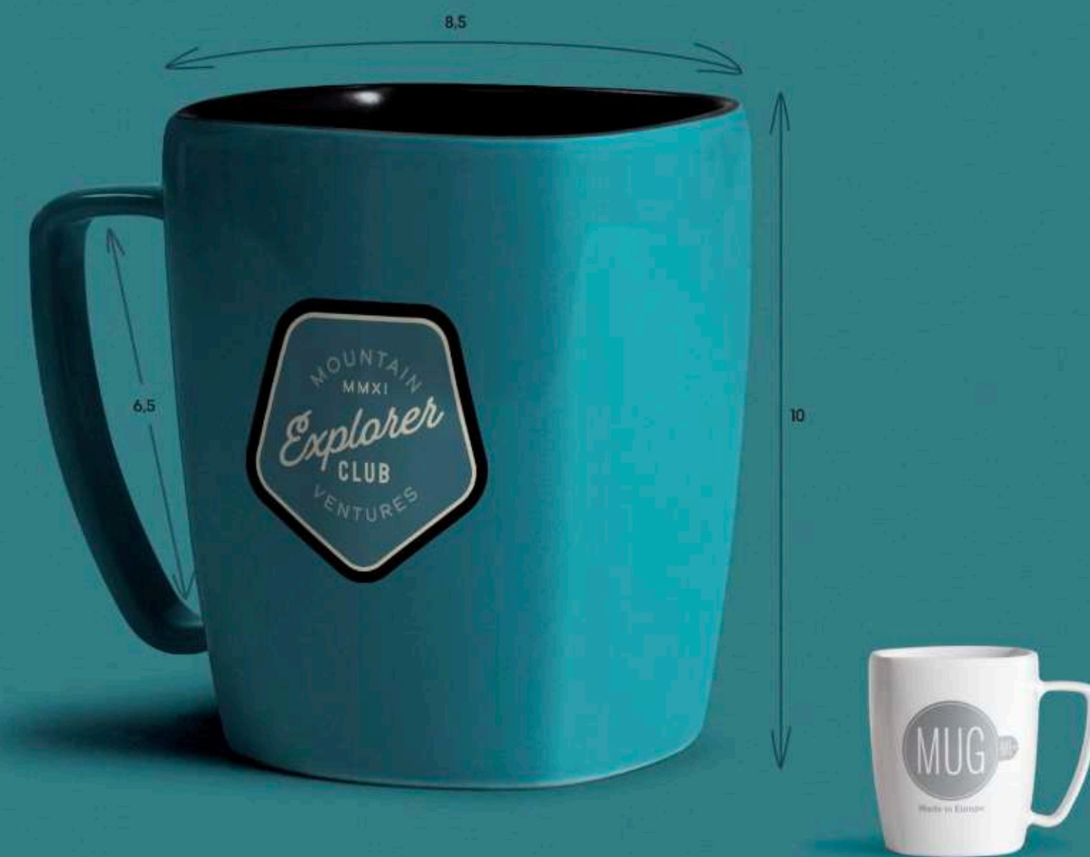
STANISLAS - MUG943 - 310ml Mug 100% Céramique Hauteur : 10cm Marquage : transfert sérigraphique vitrifié Quantité mini : 100 pièces

ENCORE UNE IDÉE... L'INTÉRIEUR AU PANTONE !