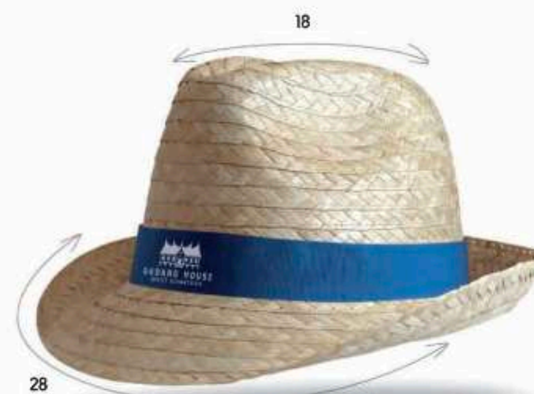
DOU22 - DOULOS Chapeau en paille blanche avec biais paille Bandeau cousu Taille : 57 ou 59 au choix Quantité mini : 100 pièces