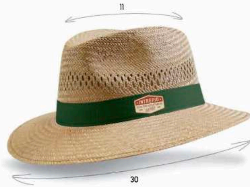
PAN09 - PANAMA Chapeau en paille épaisse avec biais paille Tissage très régulier qualitatif Bandeau cousu Taille : 57 ou 59 au choix Quantité mini : 100 pièces