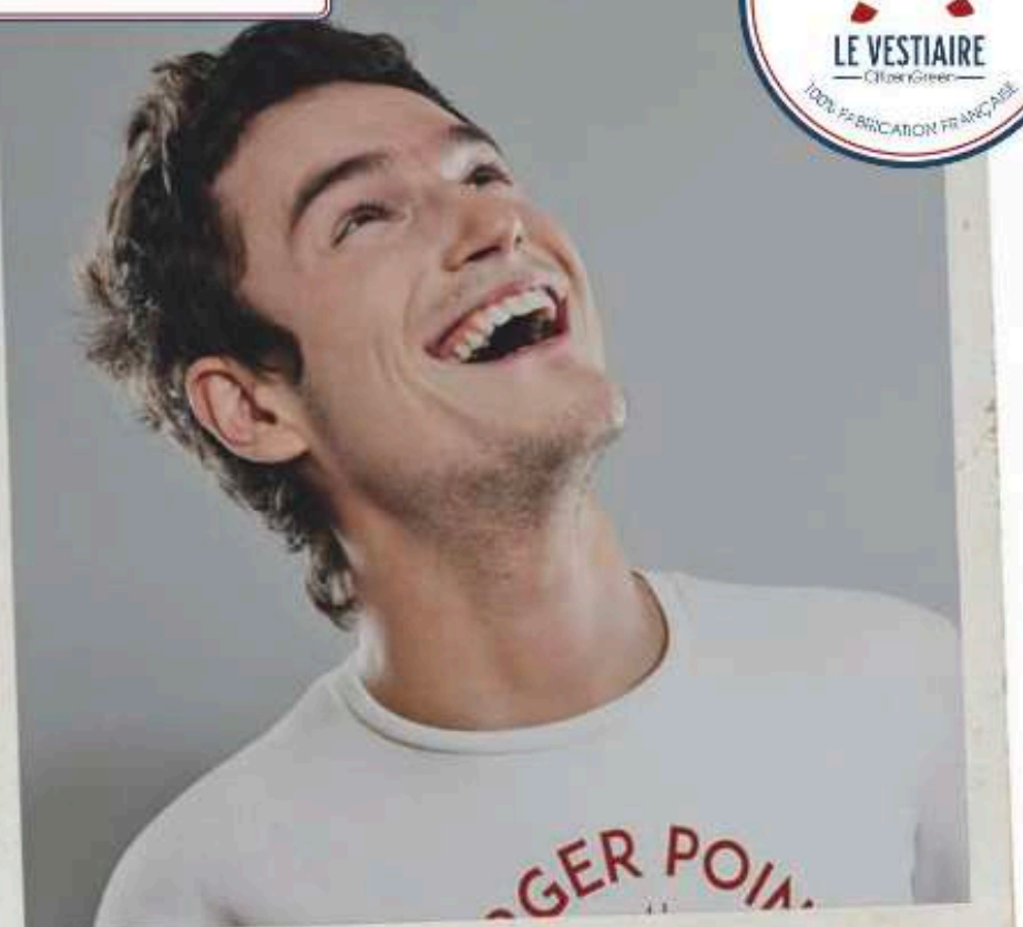
sweat French terry