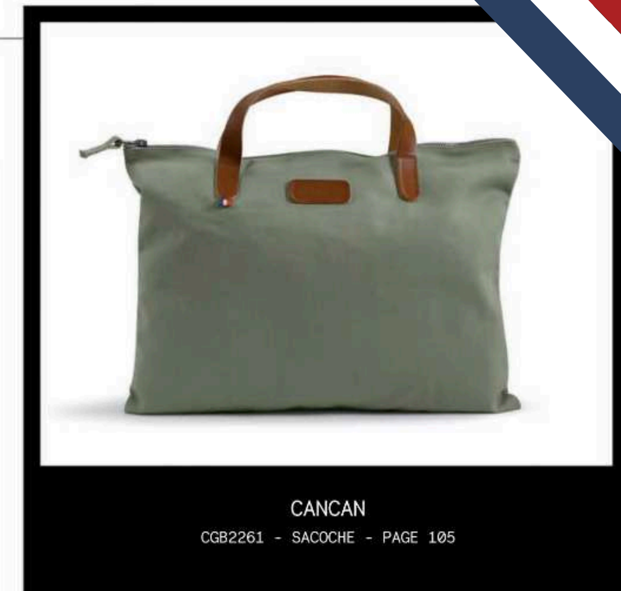
CANCAN CGB2261 - SACOCHE - PAGE 105