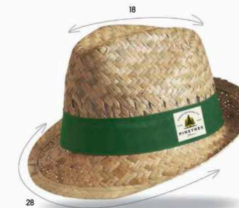
DOU20 - DOULOS Chapeau en paille dorée avec biais paille ajourée avec motifs Bandeau cousu Taille : 57 ou 59 au choix Quantité mini : 100 pièces

TOUS LES VISUELS PRÉSENTÉS NE SONT QUE PUREMENT INDICATIFS POUR ILLUSTRER LES POSSIBILITÉS DE MARQUAGE SUR NOS PRODUCTIONS