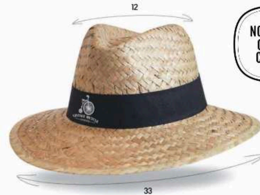
PAN20 - PANAMA Chapeau en paille dorée ajourée à motif avec biais paille Bandeau cousu Taille : 57 ou 59 au choix Quantité mini : 100 pièces

2023-2024 NOUVEAUTÉ COUP DE CHAPEAU BY BEWEAR