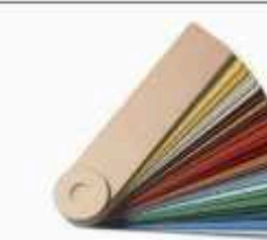
À PARTIR DE 250 PIÈCES