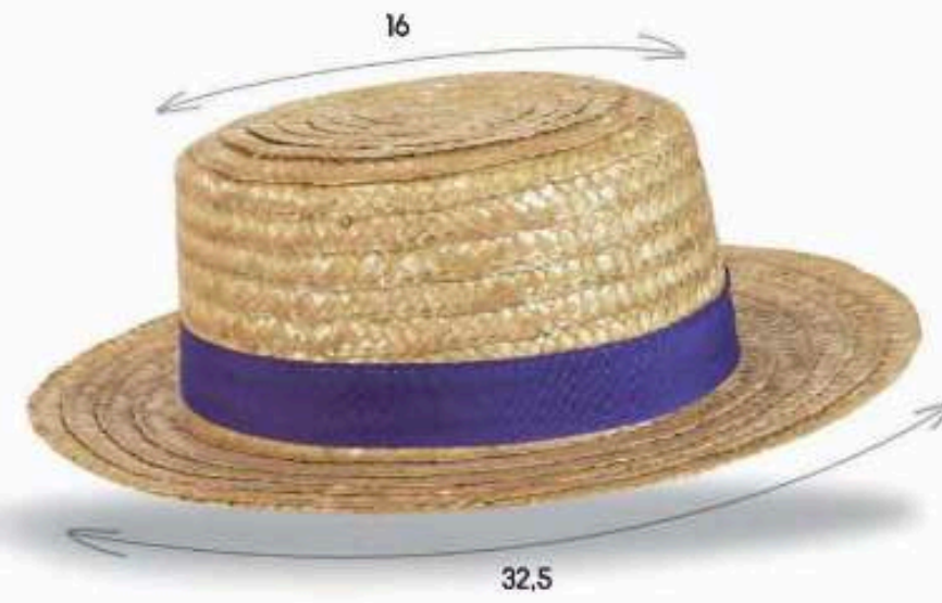
CANO1 - CANOTIER Chapeau en paille dorée Tressage de paille cousue Bandeau cousu Taille : 57 ou 59 au choix Quantité mini : 100 pièces