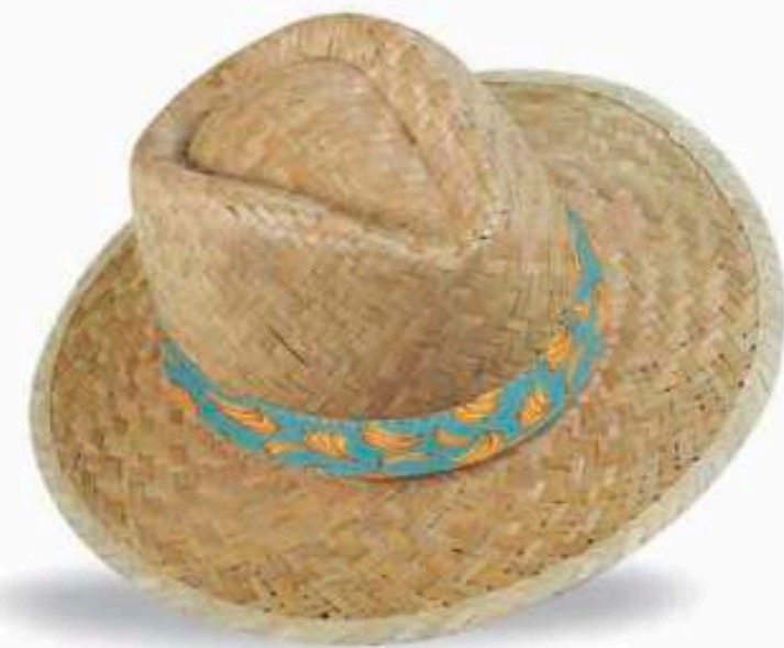
PAN01 - PANAMA Chapeau en paille dorée avec biais paille Bandeau cousu Taille : 57 ou 59 au choix Quantité mini : 100 pièces