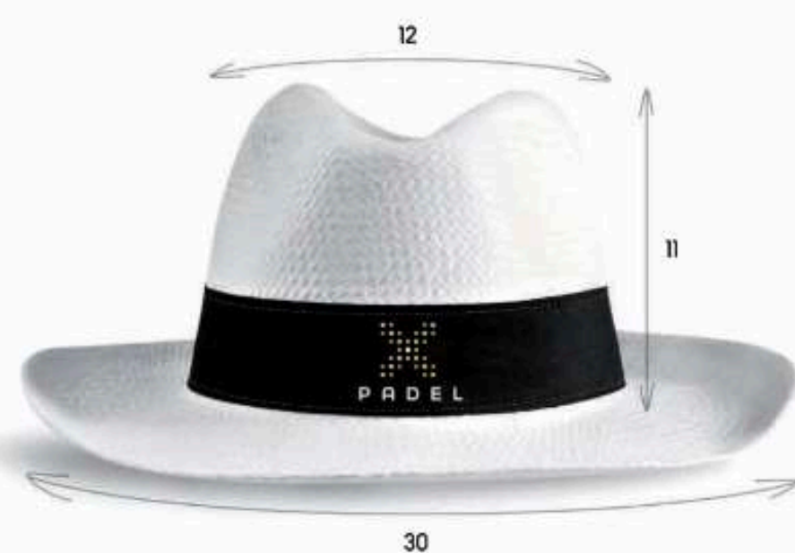
BOR01 - BORSALINO Chapeau en fibre de papier blanc souple avec biais Bande anti-sudation Bandeau cousu Taille : 57 ou 59 au choix Quantité mini : 100 pièces