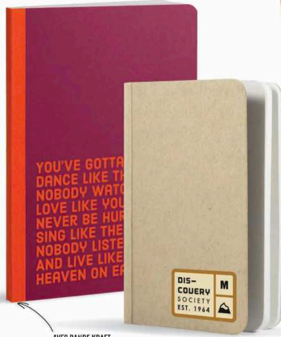
AVEC BANDE KRAFT SUR LA TRANCHE (COLORIS KRAFT OU FLUO)

LES COUVERTURES SEMI-RIGIDES AVEC BANDE KRAFT