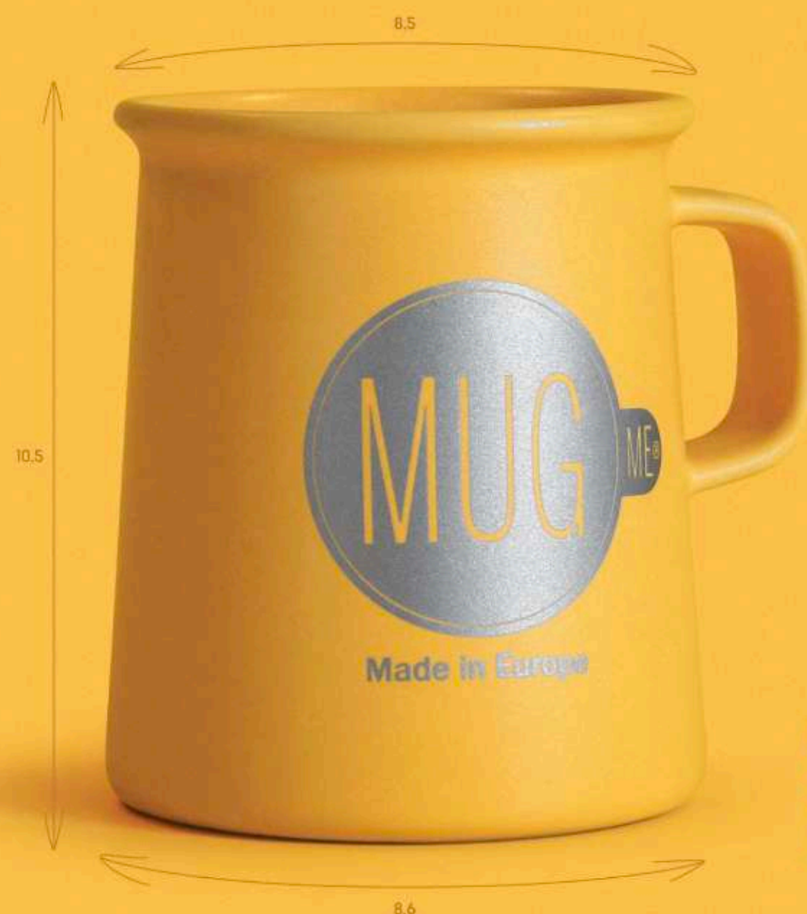
PERETTE - MUG930 - 350ml Mug 100% Céramique Hauteur : 10,5 cm Option bord coloré Marquage : transfert sérigraphique vitrifié Quantité mini : 100 pièces

LA TENDANCE « MADELEINE DE PROUST » PARCE QUE VOTRE ENFANCE N'EST PAS SI LOINTAINE...