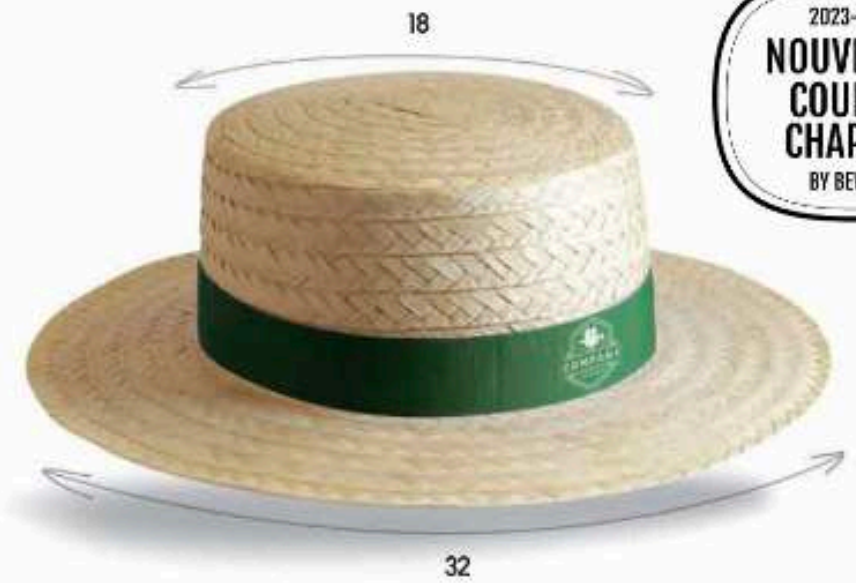
CANO2 - CANOTIER Chapeau en paille blanche Tressage de paille cousu Bandeau cousu Taille : 57 ou 59 au choix Quantité mini : 100 pièces

2023-2024 NOUVEAUTÉ COUP DE CHAPEAU BY BEWEAR