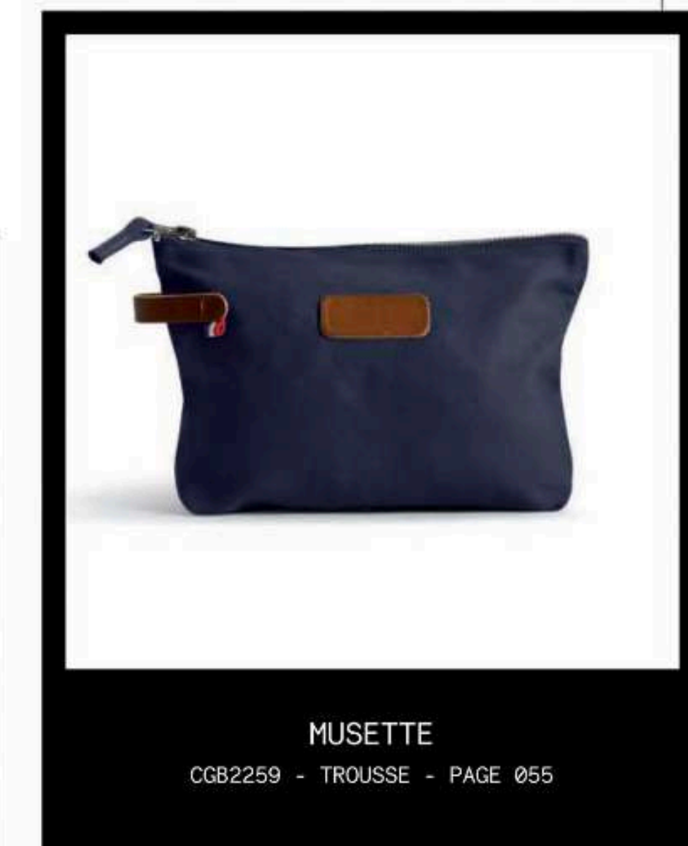
MUSETTE CGB2259 - TROUSSE - PAGE 055

PUCE BLEU BLANC ROUGE ATTRIBUTS CUIR ESPÈCE BOVINE MOUSQUETON INTÉRIEUR CLÉS