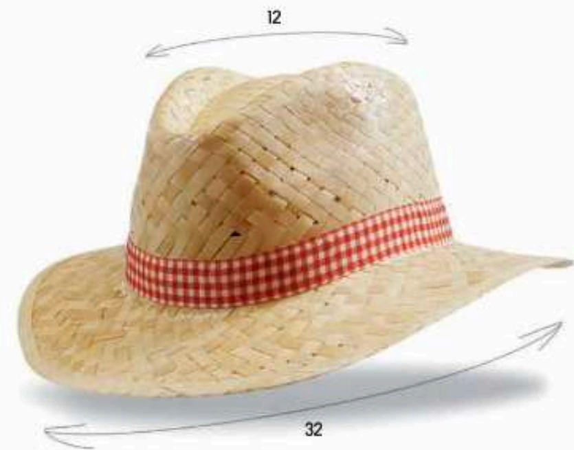
PAN04 - PANAMA Chapeau en paille blanche avec biais paille Bandeau cousu Taille : 57 ou 59 au choix Quantité mini : 100 pièces