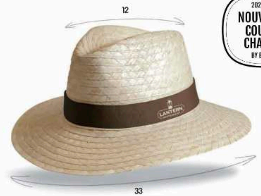
PAN21 - PANAMA Chapeau en paille blanche avec biais paille Bandeau cousu Taille : 57 ou 59 au choix Quantité mini : 100 pièces

2023-2024 NOUVEAUTÉ COUP DE CHAPEAU BY BEWEAR