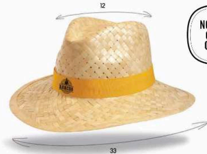
PAN22 - PANAMA Chapeau en paille blanche avec biais paille Bandeau cousu Taille : 57 ou 59 au choix Quantité mini : 100 pièces

2023-2024 NOUVEAUTÉ COUP DE CHAPEAU BY BEWEAR