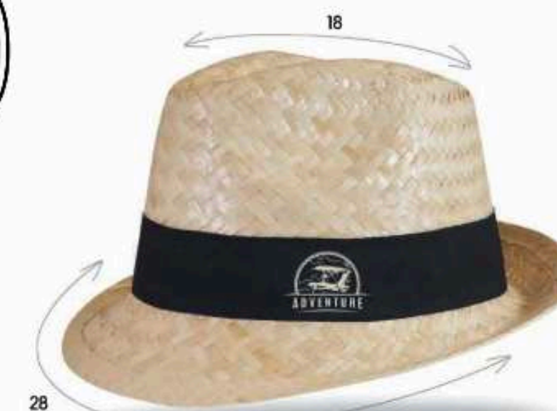
DOU21 - DOULOS Chapeau en paille blanche avec biais paille Bandeau cousu Taille : 57 ou 59 au choix Quantité mini : 100 pièces