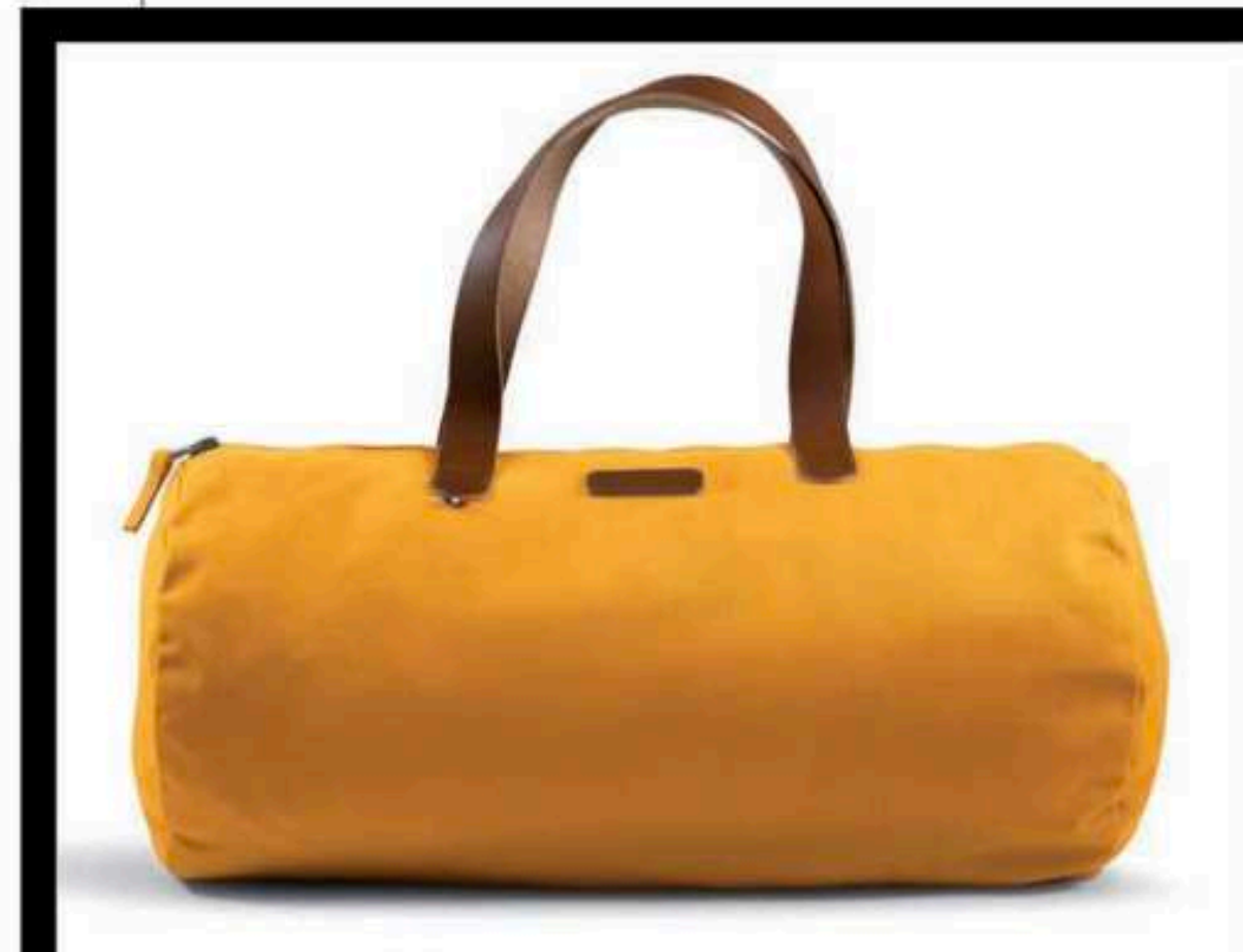
RIGODON CGB2260 - SAC POLOCHON - PAGE 086